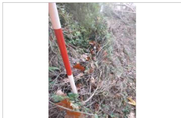
Berge rive gauche forêt amont

GÉNÉRAL Code : AGERIN2018_R_82_1 Date de mise à jour : 11/12/2019 Auteur : SPC MO