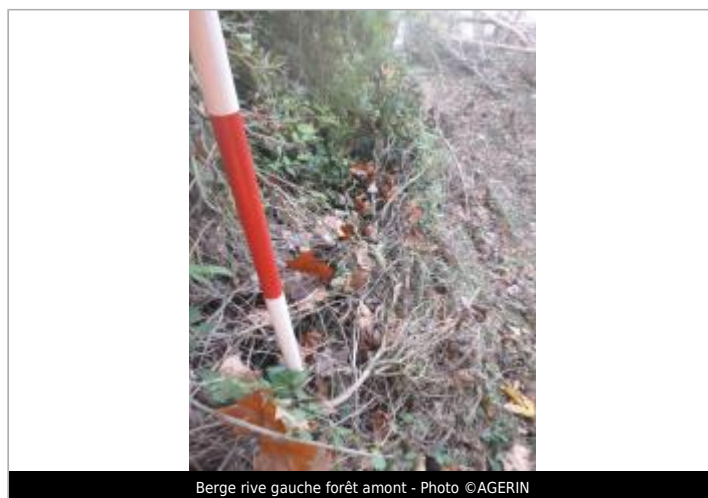
Berge rive gauche forêt amont

GÉOLOCALISATION Coordonnées WGS84 : X: 2.25319029 / Y: 42.99709420 Coordonnées RGF93 (Lambert 93) X: 639047.86 / Y: 6211148.84 Coordonnées RGF93 (ETRS89) : X: 2.2531903 / Y: 42.9970942 Code Hydro: Y1--0200 Rive de référence: Gauche