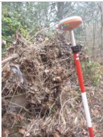
Berge rive gauche forêt