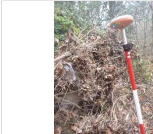
Berge rive gauche forêt