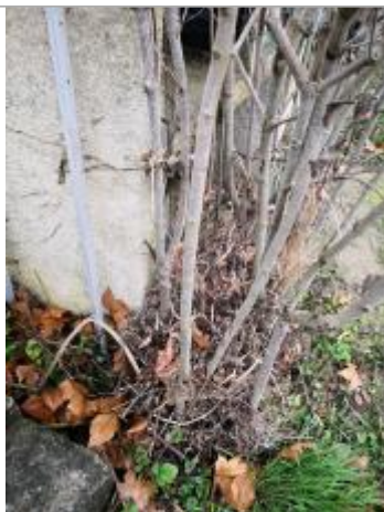
Berge rive gauche - Photo ©AGERIN

Altitude calculée de l'eau (en m) : 306.13