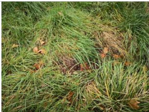
Berge rive gauche champ

Altitude calculée de l'eau (en m) : 305.75