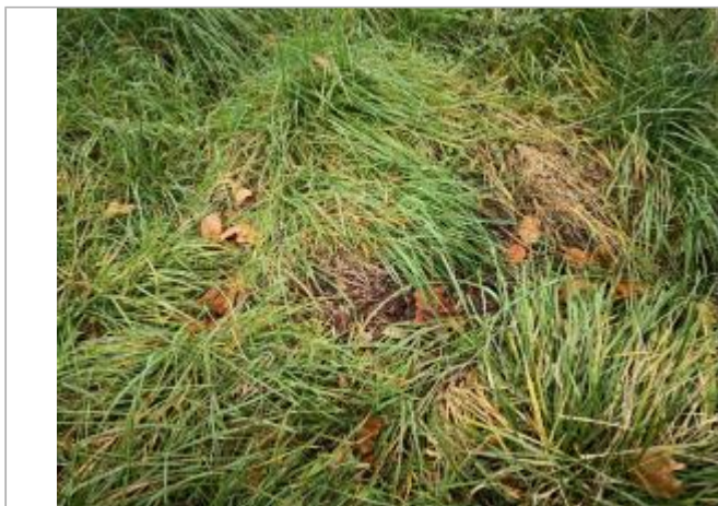
Berge rive gauche champ