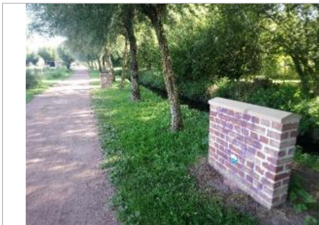
Repère de crue en rive gauche de la Loisme