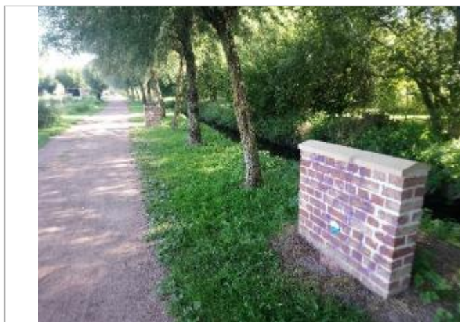
Repère de crue en rive gauche de la Loisme