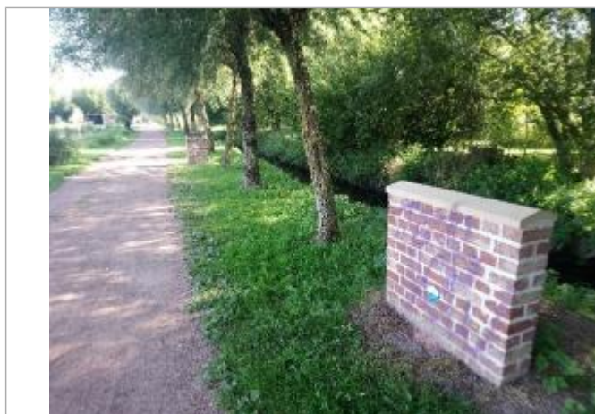
Repère de crue en rive gauche de la Loisme