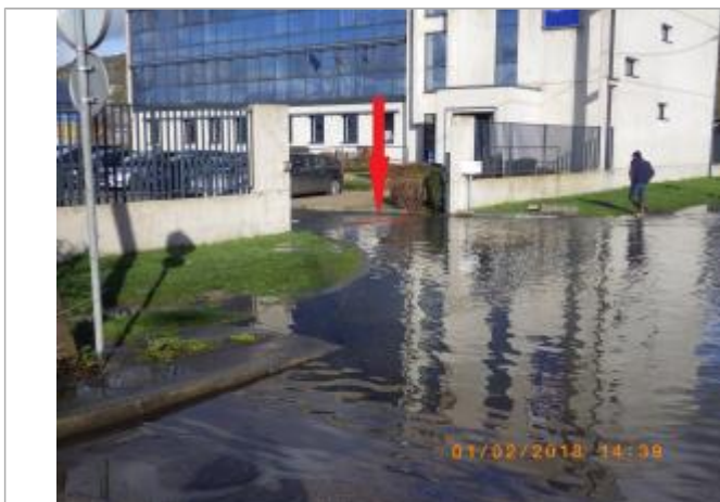
L'eau a atteint l'entrée de la cour.

Altitude calculée de l'eau (en m) : 5.27 m