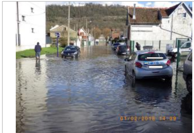
Vue de la rue pendant la crue

Coordonnées WGS84 : X: 1.10693540 / Y: 49.42165800