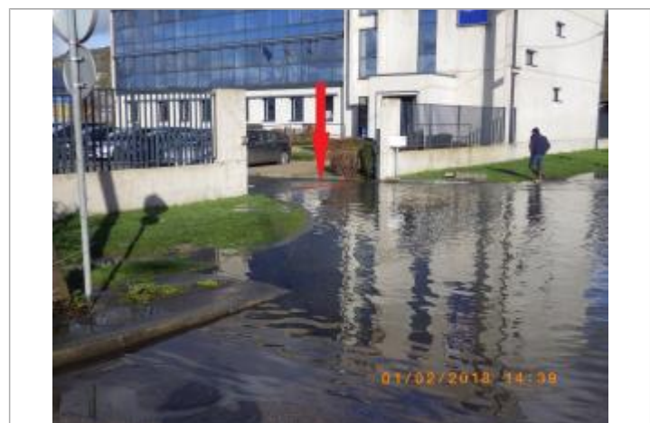
L'eau a atteint l'entrée de la cour.

MARQUE Maximum de l'inondation : Oui Visibilité : Non État du repère : Disparu Pérennité : Aucune