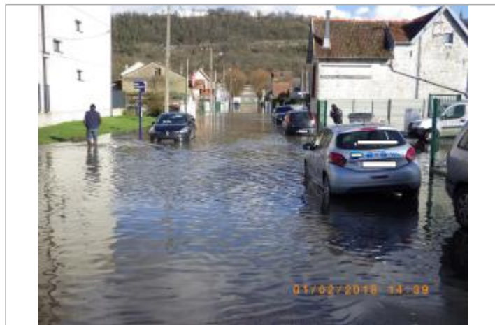
Vue de la rue pendant la crue

GÉOLOCALISATION Coordonnées WGS84 : X: 1.10693540 / Y: 49.42165800 Coordonnées RGF93 (Lambert 93) X: 562618.68 / Y: 6926335.86 Coordonnées RGF93 (ETRS89) : X: 1.1069354 / Y: 49.421658 Code Hydro: ----0010 Rive de référence: Gauche