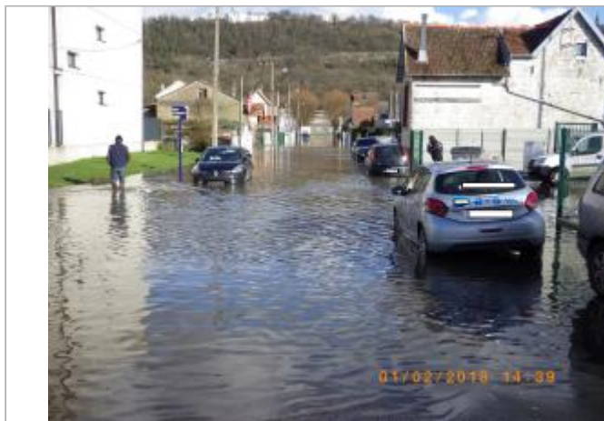
Vue de la rue pendant la crue