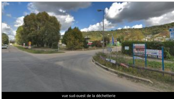
vue sud-ouest de la déchetterie