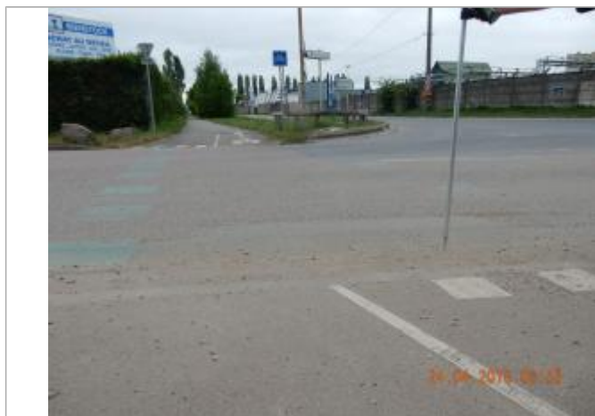
niveau atteint par l'eau sur la rue blaise pascal

CAMPAGNE DE NIVELLEMENT DU SPC SACN. LE SPC N'EST PAS GÉOMÈTRE EXPERT, LES COTES SONT INDIQUÉES À TITRE INDICATIF. - 24/04/2018