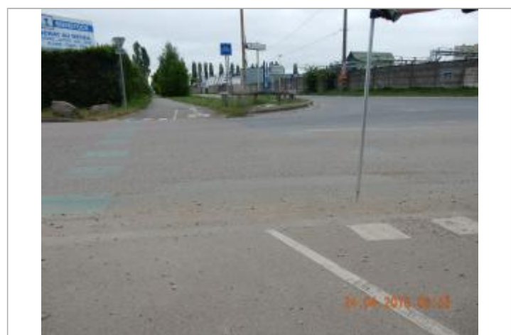
niveau atteint par l'eau sur la rue blaise pascal

MARQUE Maximum de l'inondation : Oui Visibilité : Non État du repère : Disparu Pérennité : Aucune