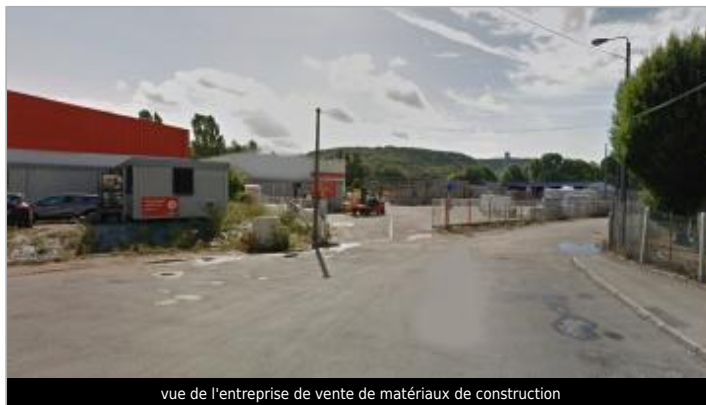
vue de l'entreprise de vente de matériaux de construction