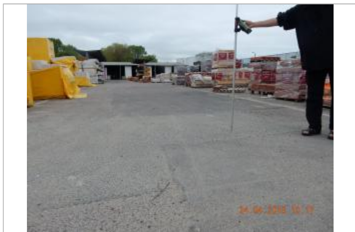
repère sur parking de stockage de matériaux de l'entreprise

NIVELLEMENT EFFECTUÉ PAR LE SPC SACN. LE SPC N'EST PAS GÉOMÈTRE EXPERT, LES COTES SONT DONNÉES À TITRE INDICATIF. - 24/04/2018