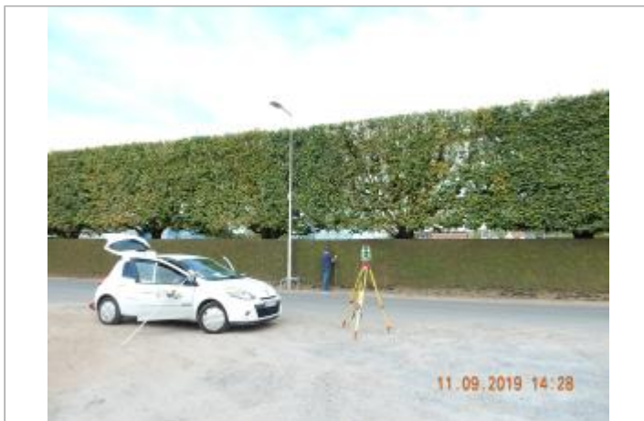
Rue Pierre de Coubertin (Haie située le long du stade)