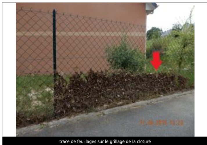
trace de feuillages sur le grillage de la clôture

Maximum de l'inondation : Oui Visibilité : Oui État du repère : Mauvais Pérennité : Aucune