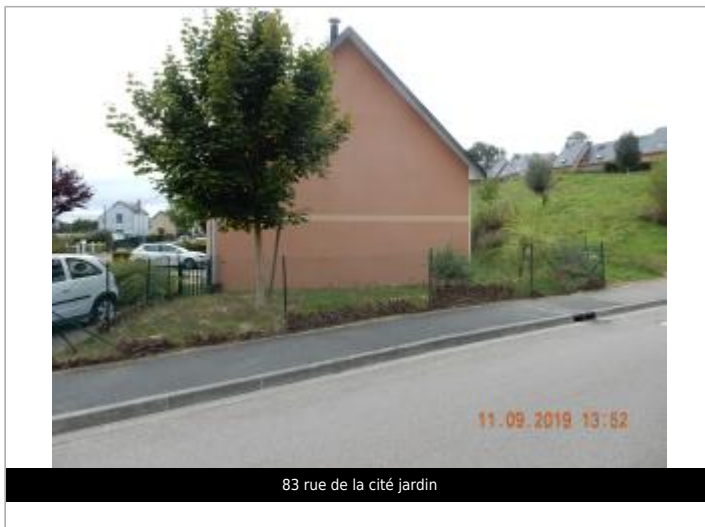
83 rue de la cité jardin