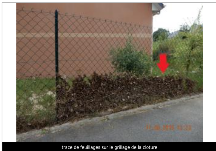
trace de feuillages sur le grillage de la clôture

Altitude calculée de l'eau (en m) : 45.77