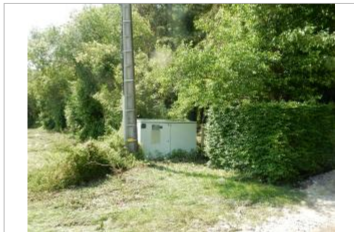
transformateur électrique route de Manerbes

GÉOLOCALISATION Coordonnées WGS84 : X: 0.19114002 / Y: 49.19620200 Coordonnées RGF93 (Lambert 93) X: 495290.1 / Y: 6903249.71 Coordonnées RGF93 (ETRS89) : X: 0.19114 / Y: 49.196202 Code Hydro: I0-0200 Rive de référence: Gauche