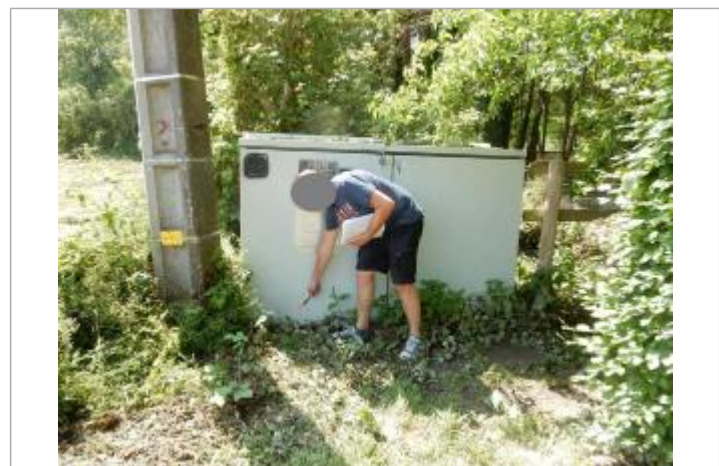
trace peinte sur transformateur

GÉNÉRAL Code : WEB_R_201912022720 Date de mise à jour : 29/09/2022 Auteur : CONTRIBUT_01