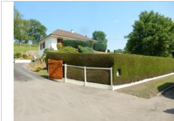
48 route de Manerbes