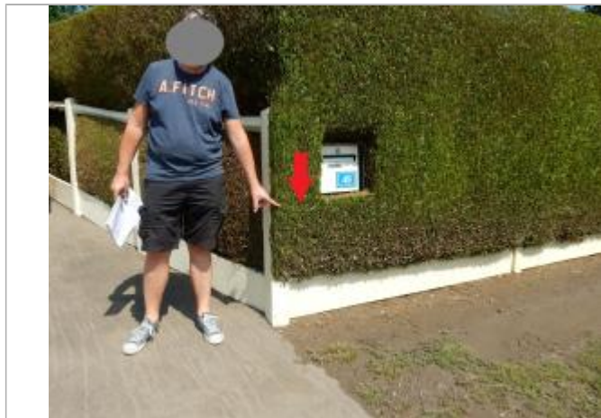
trace sur la haie

Altitude calculée de l'eau (en m) : 33.54 m