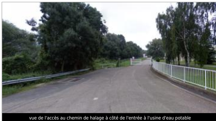
vue de l'accès au chemin de halage à côté de l'entrée à l'usine d'eau potable