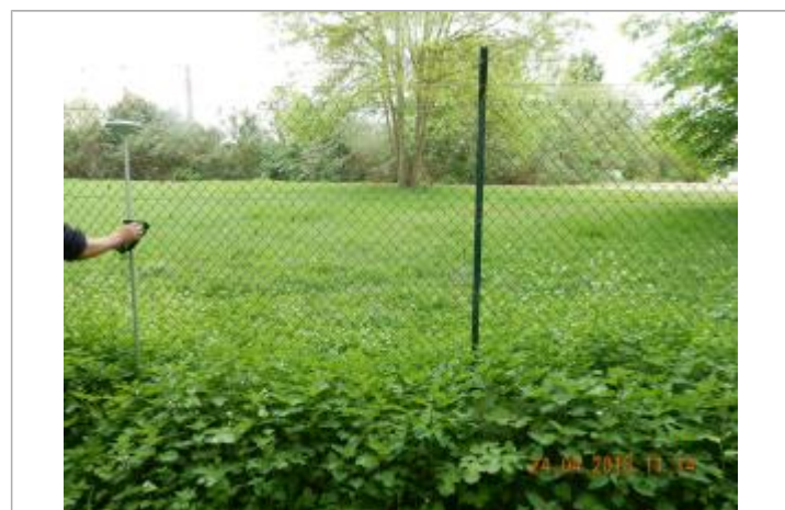
vue du grillage séparant le chemin de halage de l'usine d'eau potable