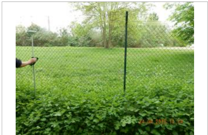
vue du grillage séparant le chemin de halage de l'usine d'eau potable

MARQUE Maximum de l'inondation : Oui Visibilité : Oui État du repère : Disparu Pérennité : Aucune