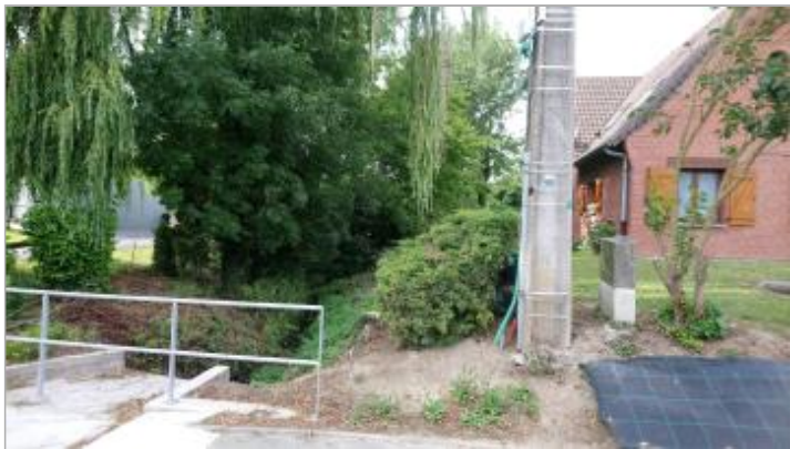
Site de Gauchin-Legal

Texte : Le Ruisseau de Caucourt Crue de Juillet 1987 Maximum de l'inondation : Oui Visibilité : Oui État du repère : Bon Pérennité : Longue