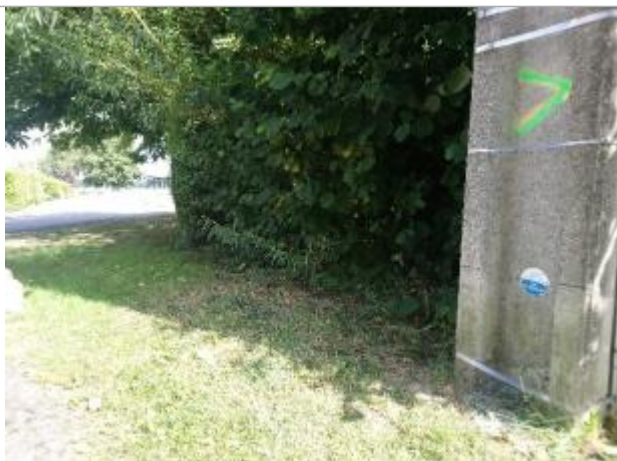
Repère de crue en rive droite de la Zerlebecque

Altitude calculée de l'eau (en m) : 46.854 m