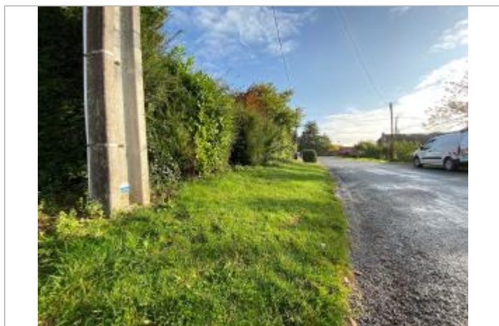
Repère de crue en rive gauche de la Traxenne

Code : WEB_R_201911293523 Date de mise à jour : 26/01/2022 Auteur : SYMSAGEL