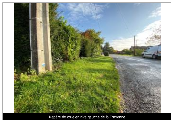
Repère de crue en rive gauche de la Traxenne