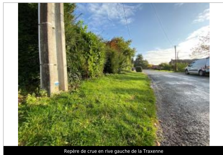
Repère de crue en rive gauche de la Traxenne

GÉNÉRAL Code : WEB_R_201911293523 Date de mise à jour : 26/01/2022 Auteur : SYMSAGEL