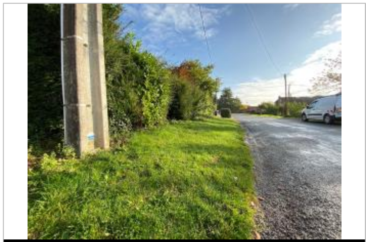
Repère de crue en rive gauche de la Traxenne

GÉNÉRAL Code : WEB_R_201911293523 Date de mise à jour : 26/01/2022 Auteur : SYMSAGEL