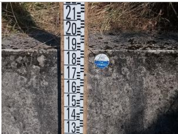
Repère de crue en rive gauche du Surgeon

Altitude calculée de l'eau (en m) : 55.465