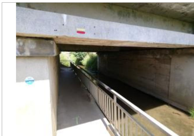
Repère de crue en rive gauche de la Nave