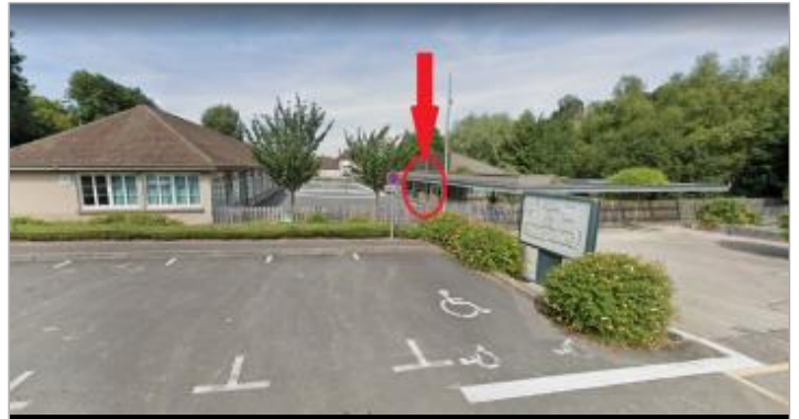
Porte de la classe de l'école

Coordonnées WGS84 : X: 0.20833656 / Y: 49.13726520