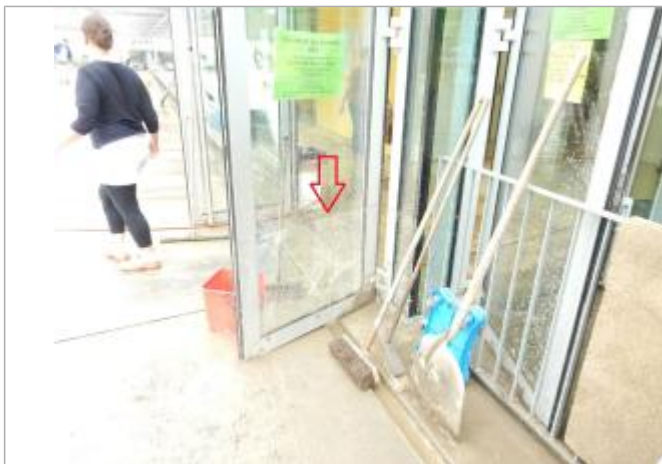
trace sur vitre de la porte à 67 cm/sol.

SOURCE DE REPÉRAGE : VISITE DE TERRAIN SPC SACN - 11/03/2020