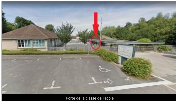
Porte de la classe de l'école