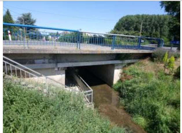
Repère de crue en rive gauche de la Nave

Coordonnées RGF93 (ETRS89) : X: 2.4366002 / Y: 50.572623