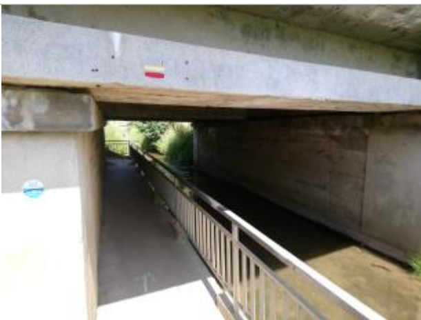
Repère de crue en rive gauche de la Nave

Altitude calculée de l'eau (en m) : 29.855