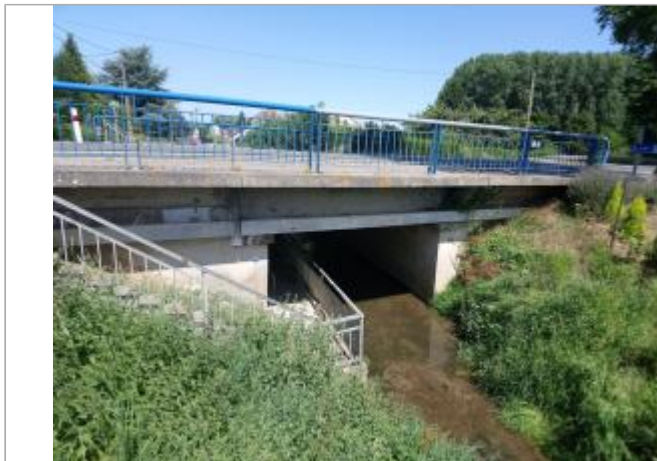
Repère de crue en rive gauche de la Nave