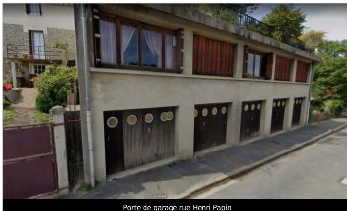
Porte de garage rue Henri Papin