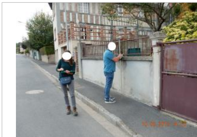
Trace sur le mur du jardin

Maximum de l'inondation : Oui Visibilité : Oui État du repère : Mauvais Pérennité : Aucune