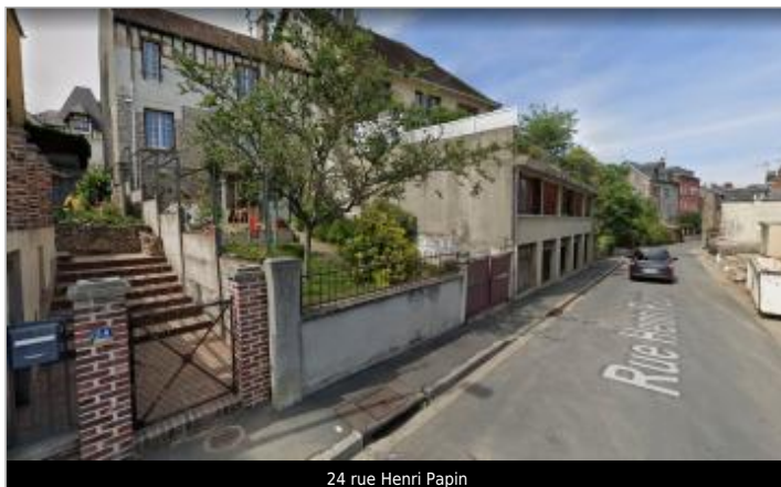
24 rue Henri Papin