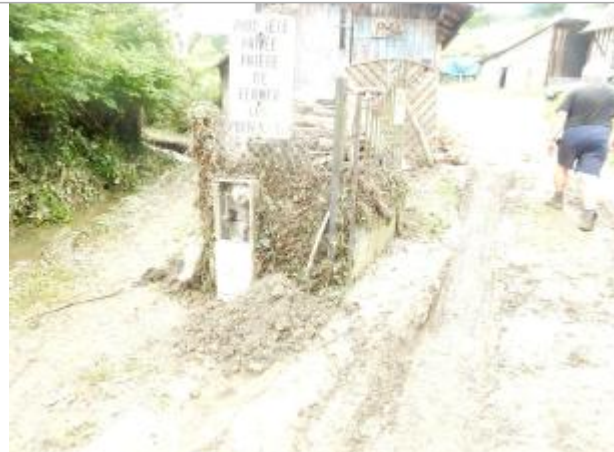
6 chemin des Bourguignolles