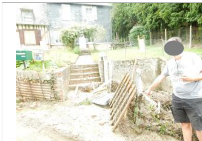
Feuillages et branchages sur grillage

Altitude calculée de l'eau (en m) : 53.56 m