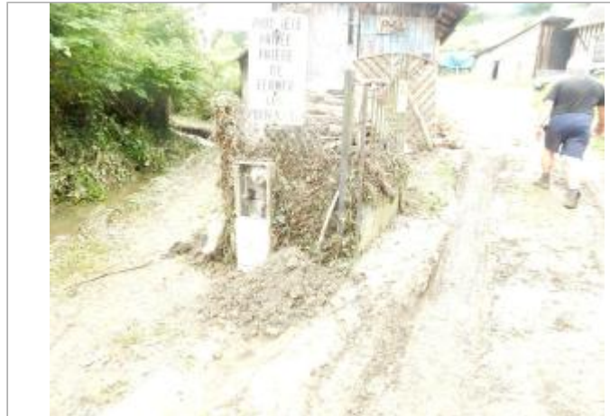
6 chemin des Bourguignolles

Coordonnées WGS84 : X: 0.21092751 / Y: 49.14136200