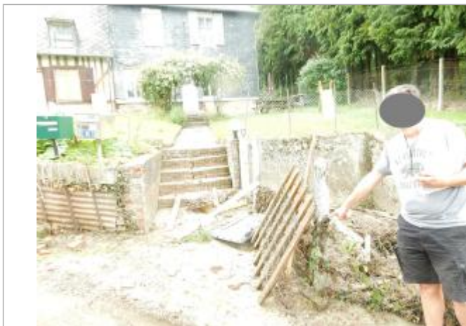
Feuillages et branchages sur grillage