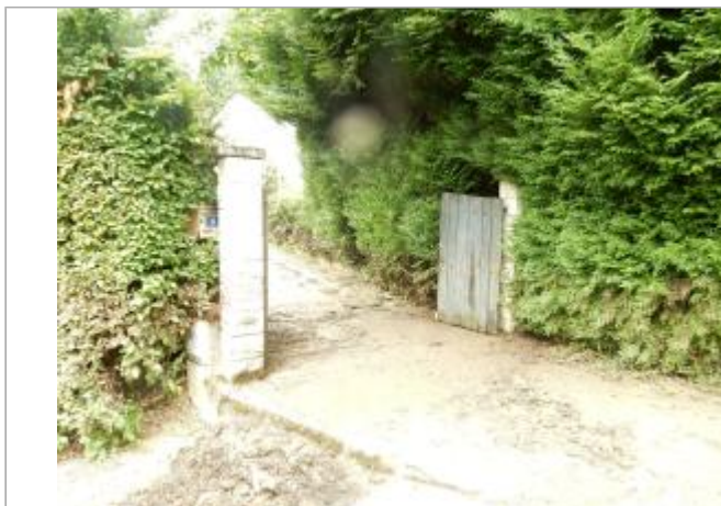
4 chemin des Bourguignolles