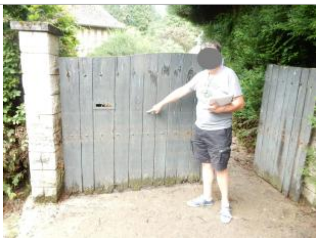
trace sur portail en bois

Altitude calculée de l'eau (en m) : 53.58