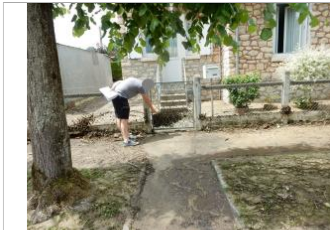
Feuillages et branchages sur grillage

SOURCE DE REPÉRAGE : VISITE DE TERRAIN SPC SACN - 11/03/2020