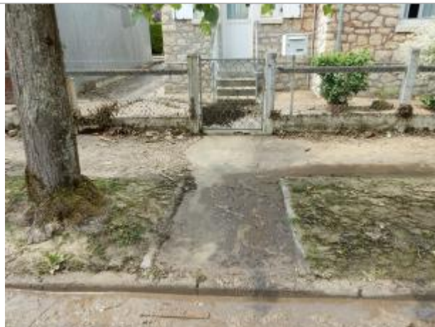
9 rue Paul Doumergue