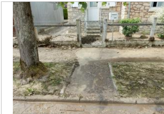
9 rue Paul Doumergue