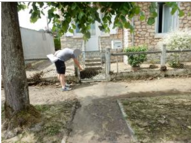
Feuillages et branchages sur grillage

Altitude calculée de l'eau (en m) : 42.12 m