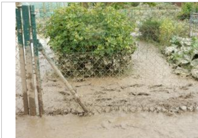
Jardin potager rue de Coubertin