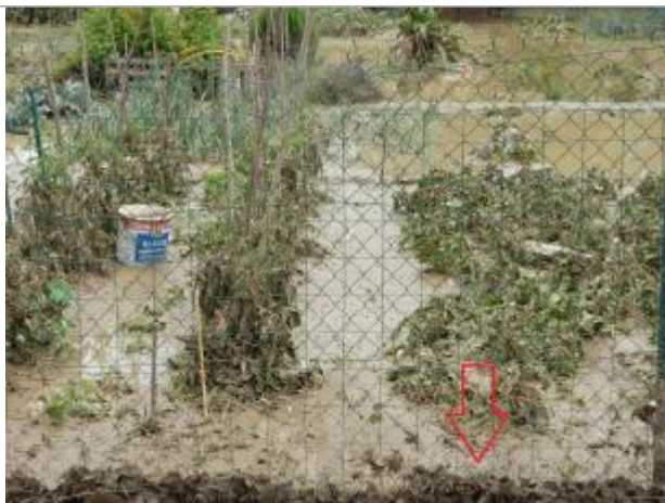
trace sur grillage au niveau du 3 ème carreau en partant du bas

Altitude calculée de l'eau (en m) : 39.36 m