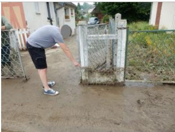
trace visibles sur poteau blanc du portail

Altitude calculée de l'eau (en m) : 39.44 m