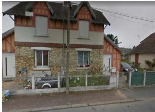
n°3 rue de Coubertin