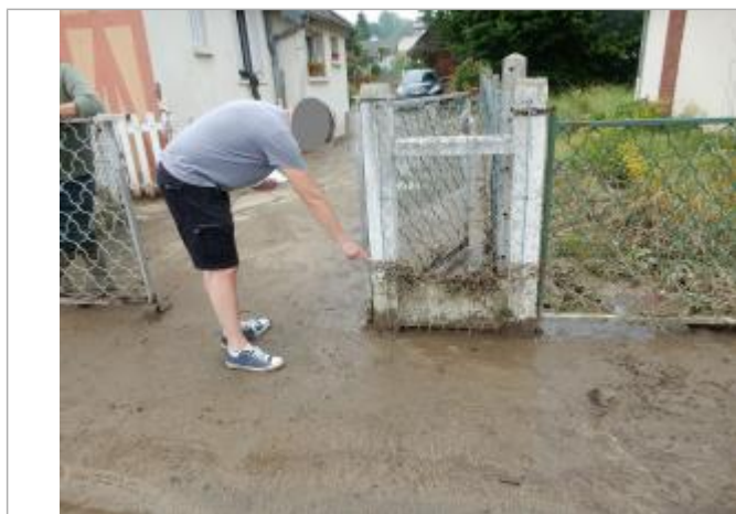
trace visibles sur poteau blanc du portail

Altitude calculée de l'eau (en m) : 39.44