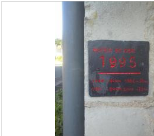
Plaque en ardoise apposée 15 rue de la croix blanche 49125 Cheffes