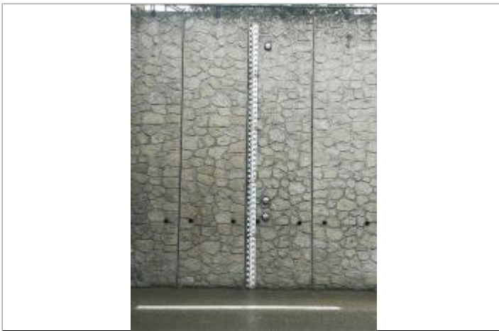
44 boulevard de France en rive droite amont du pont Joffre

GÉOLOCALISATION Coordonnées WGS84 : X: 2.89301881 / Y: 42.70306510 Coordonnées RGF93 (Lambert 93) X: 691224.12 / Y: 6178168.51 Coordonnées RGF93 (ETRS89) : X: 2.8930188 / Y: 42.7030651