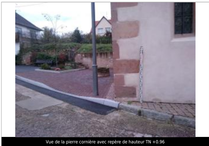
Vue de la pierre cornière avec repère de hauteur TN +0.96

GÉNÉRAL Code : WEB_R_201911152346 Date de mise à jour : 01/09/2022 Auteur : SMEAS