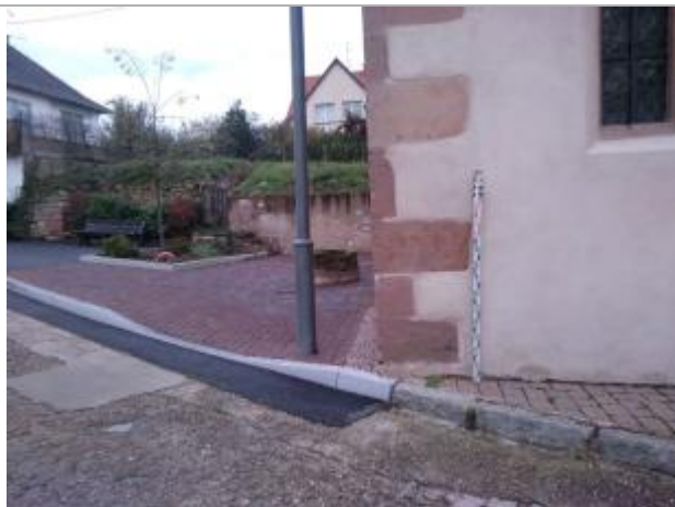
Vue de la pierre cornière avec repère de hauteur TN +0.96