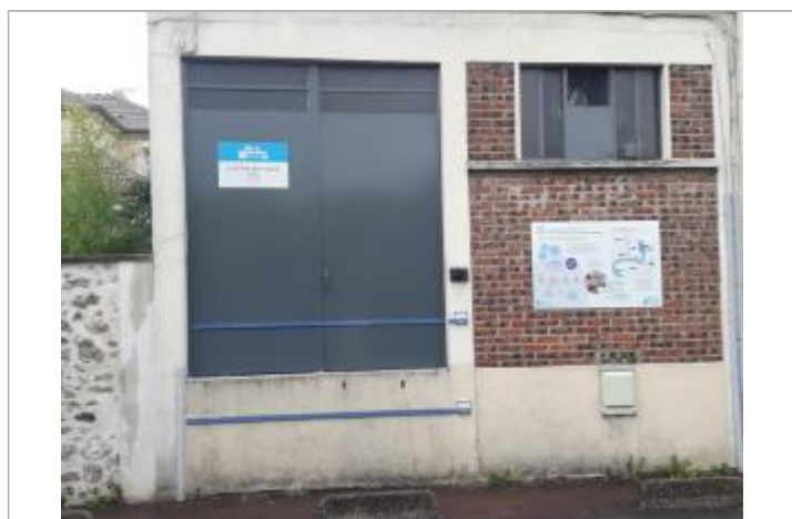
Repères de crue sur la station anti-crue du Conseil départemental du Val-de-Marne

Texte : Repères de crue sur la station anti-crue du Conseil départemental du Val-de-Marne