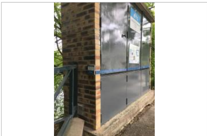
Macaron 1910 et repères pédagogiques

MARQUE Texte : Macaron 1910 et repères pédagogiques