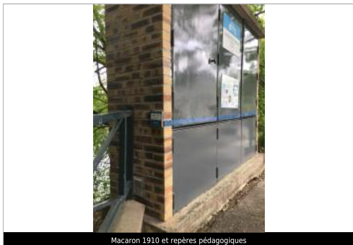
Macaron 1910 et repères pédagogiques

Texte : Macaron 1910 et repères pédagogiques