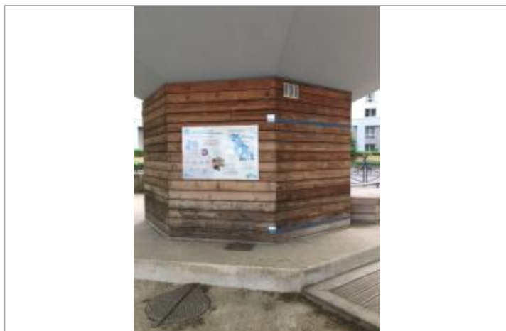
Repères de crue 1910 et 1924 + panneau pédagogique sur la station anti-crue du Conseil départemental du Val-de-Marne