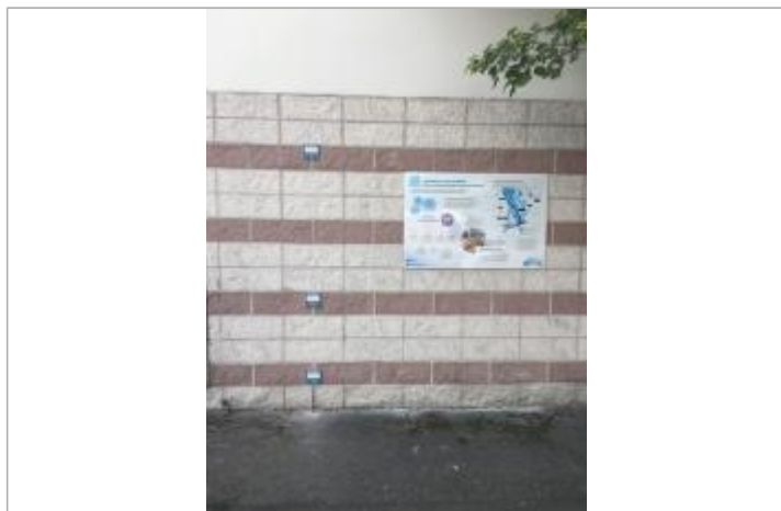
Repères de crue sur la station anti-crue départementale La Fontaine