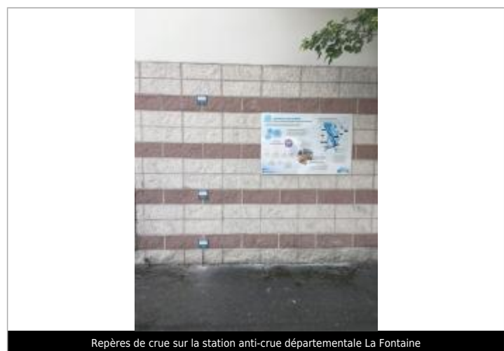
Repères de crue sur la station anti-crue départementale La Fontaine

MARQUE Texte : Crue centennale type 1910 Maximum de l'inondation : Oui Visibilité : Oui État du repère : Bon