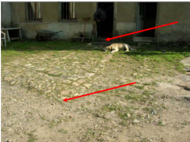
Limite basse des gros cailloux