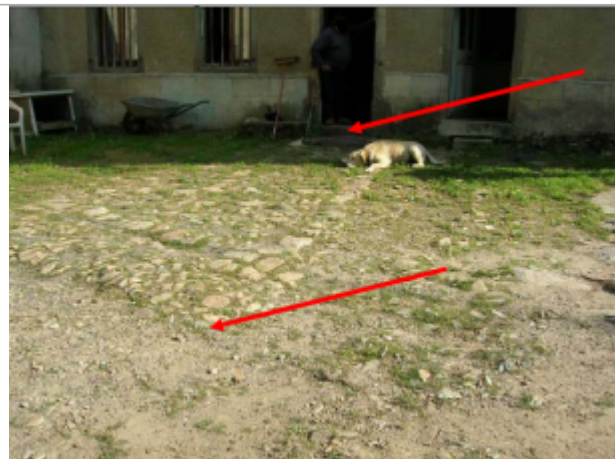
Moulin de Gastal