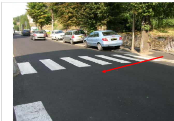
Repère niveau d'eau dans l'avenue Pierre Vialard