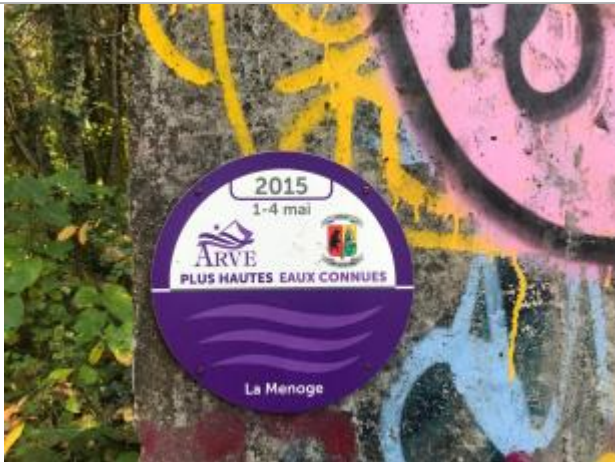
crue de la Menoge du 1 au 4 mai 2015