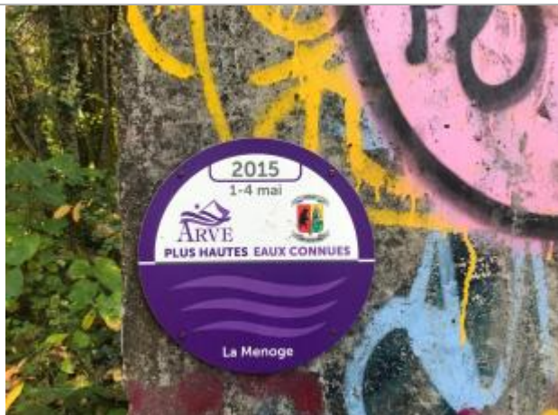
crue de la Menoge du 1 au 4 mai 2015