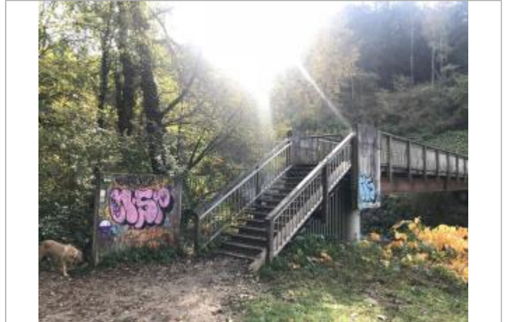
crue de la Menoge du 1 au 4 mai 2015