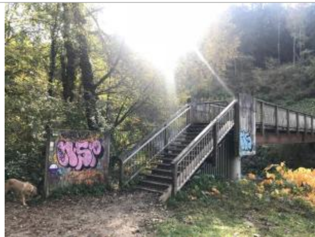
crue de la Menoge du 1 au 4 mai 2015