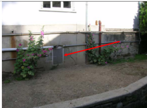
Grille derrière hotel Beauséjour