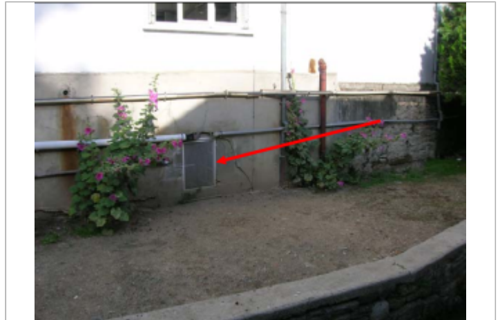
Grille derrière hotel Beauséjour