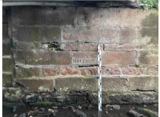
Culée latérale du pont RD426 avec indicateur TN +0.83, selon mire