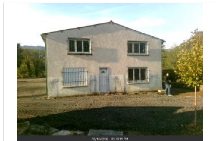
Angle droit du bâtiment, facade avec la porte d'entrée

GÉNÉRAL Code : WEB_R_201910172827 Date de mise à jour : 18/10/2019 Auteur : CITEO Ingénierie